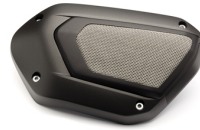
Luftfilter-Abdeckung mit Edelstahl-Gewebe, XV950 (ohne ABE)