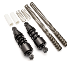
Tieferlegungssatz, mit Edelstahl-Gewebe, XV950 (ohne ABE)