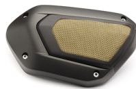
Luftfilterdeckel aus Messing, XV950